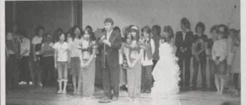
チャリティーヘアショー

が中心となり、スタッフ全員がひとつになりふたりの体験留学をサポートした。ふたりは、カンボジアで日本語の勉強をしたが片言の言葉でしか会話ができないうちに当初、まずは言葉と美容師としての接客マナーから体験。